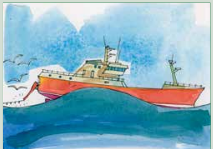
图2 在恶劣天气下，水下投绳有些困难